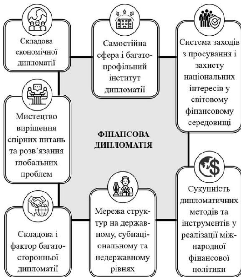
Рис. 1. Основні сутнісні характеристики поняття “фінансова дипломатія”*

Незважаючи на суспільну значимість та очевидну необхідність наукового дослідження фінансової дипломатії, її дефініювання та інтерпретація досі зумовлюють значні труднощі. Фінансову дипломатію можна без перебільшення назвати недостатньо дискутованим поняттям у науці і, водночас, багатопрофільним інститутом дипломатії і міждисциплінарним явищем з огляду на системну цілісність пізнавального процесу (рис. 1).