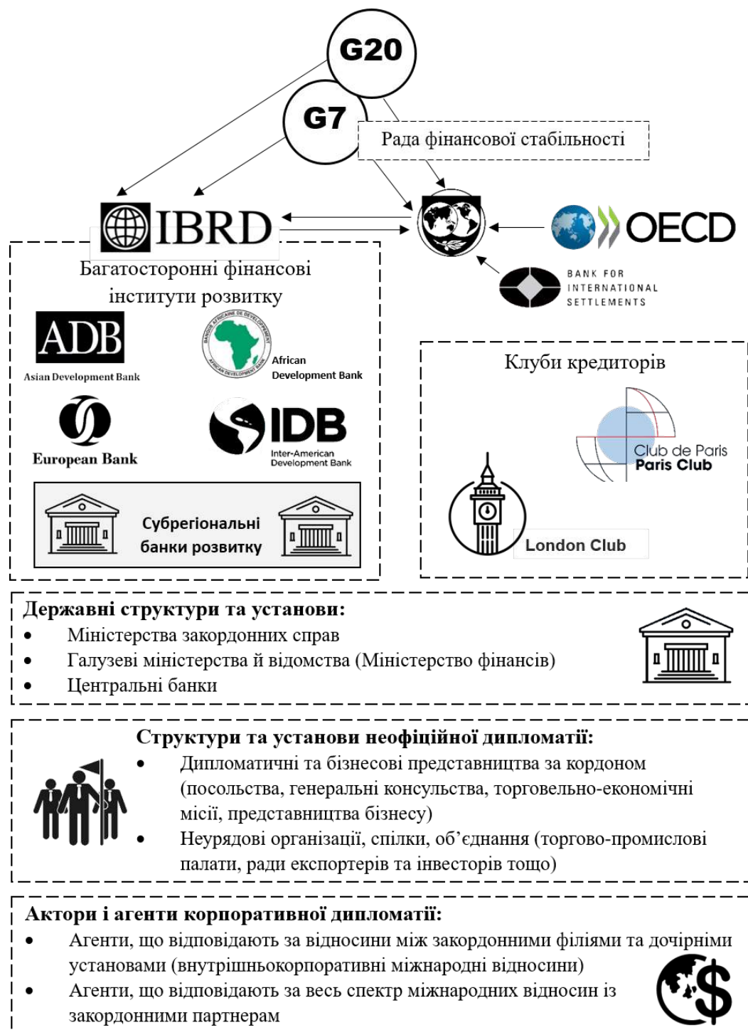
Рис. 2. Інституційна структура багатосторонньої фінансової дипломатії