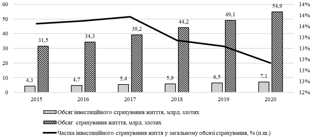
Рис. 3. Динаміка розвитку інвестиційного страхування життя у Польщі протягом 2015–2020 рр.*

* Побудовано на основі статистичних даних Національної комісії з фінансового нагляду Польщі (Komisja Nadzoru Finansowego).