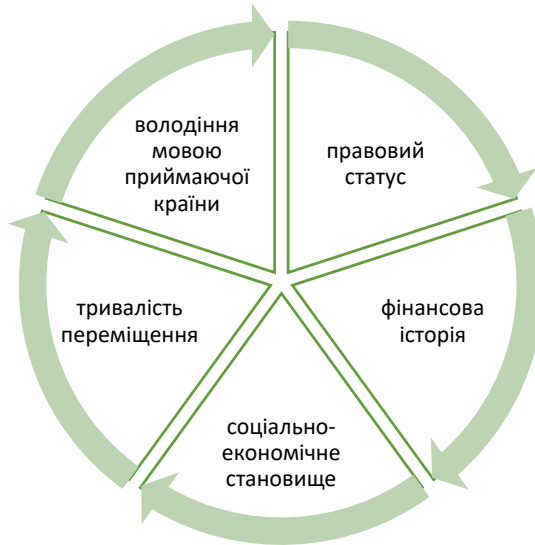
Рис. 2. Виклики для фінансової інклюзії мігрантів*