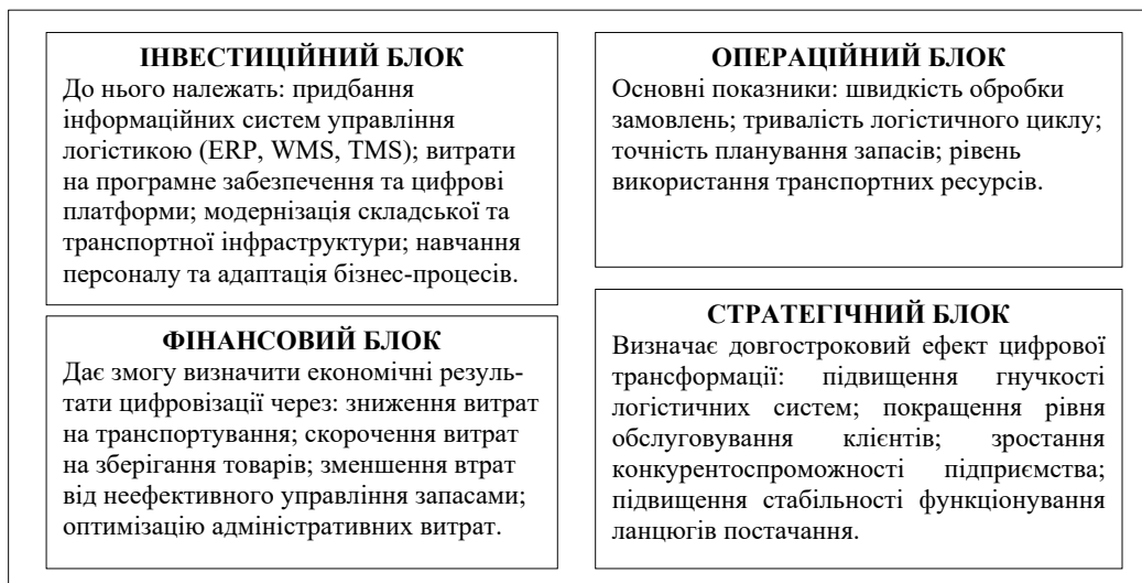
Рис. 1. Концептуальна основа моделі оцінювання економічної ефективності цифрової трансформації логістичних процесів*