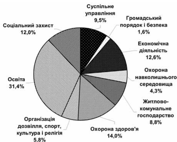
Рис. 1. Структура видатків місцевих бюджетів Польщі у 2005 р.*

Перелік доходів органів місцевого самоврядування Польщі визначається Законом "Про доходи органів територіального самоврядування" від 13 листопада 2003 р., що набув чинності 1 січня 2004 р. і