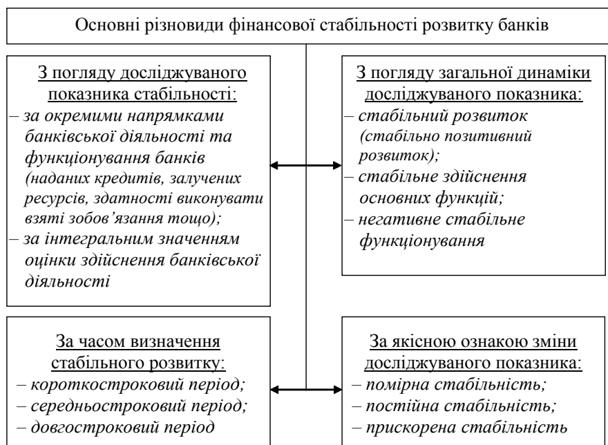
Рис. 2. Основні різновиди фінансової стабільності розвитку банків*

Таким чином, в роботі зроблено спробу навести всебічне визначення індикаторів фінансової стабільності розвитку банків на основі розкриття досліджень вітчизняних та зарубіжних вчених, встановлених рекомендацій Міжнародного валютного фонду щодо узагальнення фінансової стабільності депозитних корпорацій та основних положень відповідного нагляду з боку НБУ. Це дало змогу