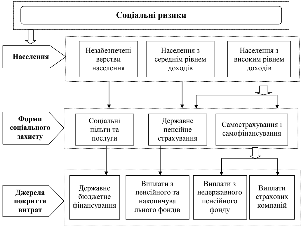
Рис. 2. Форми захисту та джерела покриття соціальних витрат*