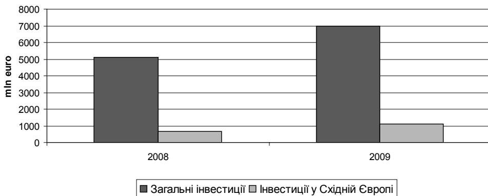
Рис. 3. Інвестиції ЄБРР