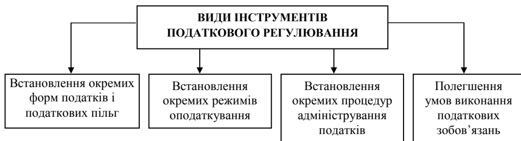
Рис. 3. Види інструментів антикризового податкового регулювання

Податкові реформи в Російській Федерації стосуються податку на прибуток, ставку якого у 2009 р. знижено з 24% до 20%, а також зменшено базу оподаткування за рахунок вирахування повної суми витрат на навчання та професійну підготовку, сум відшкодування витрат працівників зі сплати відсотків по позиках на придбання й/або будівництво житлового приміщення в розмірі до 3% від суми виплат на оплату праці (діє до 2012 р.) та внесків роботодавців на додаткове пенсійне страхування. Перші дві групи витрат також не оподатковуються податком на