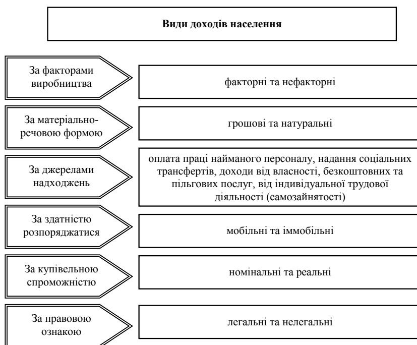
Рис. 1. Класифікація доходів населення

лення України є найменшою (4%). Такий стан речей, на наш погляд, пов'язаний перш за все з міграцією сільського населення у міста.