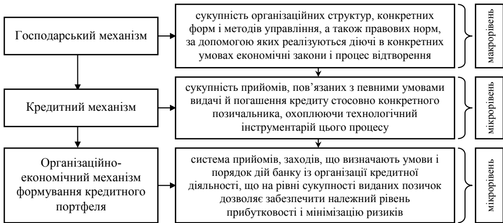
Рис. 1. Взаємозв'язок дефініцій механізму з точки зору рівня охоплення економічних відносин

У такому розумінні, коли йдеться про організацію кредитного процесу банку загалом, результатом чого є формування банківського кредитного портфеля, що охоплює всю сукупність виданих банком позичок, то в такому аспекті доцільніше вести мову про механізм формування кредитного портфеля. При цьому у зв'язку із тим, що дана діяльність банку має на меті ефективну організацію кредитних операцій, тобто таку організацію, яка спрямована на досягнення певного економічного результату в плані отримання належного рівня доходу, то мову слід вести саме про організаційно-економічний механізм формування кредитного портфеля. Отже, із вищевикладеного розуміння можна сформулювати наступне його визначення.