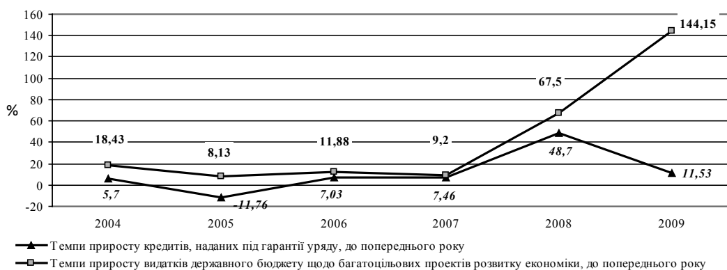
Рис. 1. Темпи приросту кредитів, наданих під гарантії уряду, та видатків Державного бюджету України щодо багатоцільових проектів розвитку економіки [5].

Державні гарантії надаються Кабінетом Міністрів України для фінансування інвестиційних, інноваційних, інфраструктурних та інших проектів розвитку, які мають стратегічне значення та реалізація яких сприятиме розвитку економіки України, в тому числі імпортозамінних і експортоорієнтованих галузей, зокрема [7]: