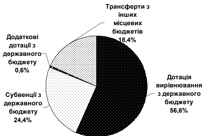
Рис. 2. Структура міжбюджетних трансфертів, що надійшли до місцевих бюджетів Тернопільської області у 2010 р.*

Вітчизняна система оподаткування є однією з найбільш складних і найменш ефективних не тільки серед країн Європи, а й у глобальному порівнянні, що регулярно підтверджують міжнародні звіти та рейтинги, дослідження вітчизняних економістів, а також оцінки інвесторів, що працюють в Україні. У рейтингу податкових систем Paying Taxes 2010, підготовленому Світовим банком спільно з PriceWaterhouseCoopers, Україна посіла 181 місце зі 183 досліджуваних країн. За даними дослідження, середньостатистичне українське підприємство протягом року сплачує 147 податків та платежів, що є найгіршим показником у світі (183 місце). Для порівняння, в Росії