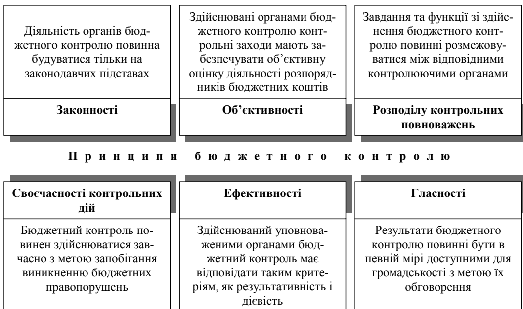
Рис. 1. Принципи бюджетного контролю*

Відповідно до принципу законності діяльність органів бюджетного контролю регламентується положеннями Конституції України, Бюджетного кодексу України,