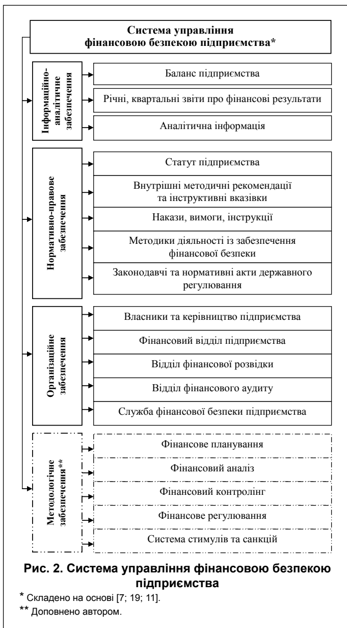
Рис. 2. Система управління фінансовою безпекою підприємства

фінансової безпеки підприємства, якісні і кількісні параметри використання фінансових ресурсів, обсяг останніх, а також джерела їх надходження, фінансовий план. Система інформаційного забезпечення формується на базі: даних бухгалтерського, оперативного та статистичного обліку і звітності; галузевих показників діяльності