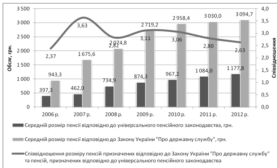
Рис. 4. Динаміка середнього розміру пенсії, призначеного згідно з Законом України "Про державне пенсійне страхування в Україні" та Законом України "Про державну службу", а також їхнє співвідношення у 2006–2012 рр. (станом на 1 січня)*

ної підгрупи та рангу за останньою посадою державної служби [2]. Слід зазначити, що в Законі України "Про загальнообов'язкове державне пенсійне страхування" розмір пенсії визначається шляхом множення заробітної плати на коефіцієнт страхового стажу. Останній розраховується на основі величини оцінки страхового стажу, розмір якого зафіксовано у законодавчому акті на рівні 1,35% [3]. Таким чином, для того, щоб особа, яка виходить на пенсію відповідно до універсального пенсійного законодавства, отримала пенсію у розмірі 80% від заробітної плати, вона повинна мати страховий стаж майже 60 років. Безумовно, що застосування принципово відмінних підходів до визначення розміру пенсій у межах єдиної солідарної пенсійної системи потребує додаткових заходів щодо закріплення різних джерел фінансових ресурсів, необхідних для фінансування пенсійних виплат. В іншому разі, розрахунок розміру пенсій