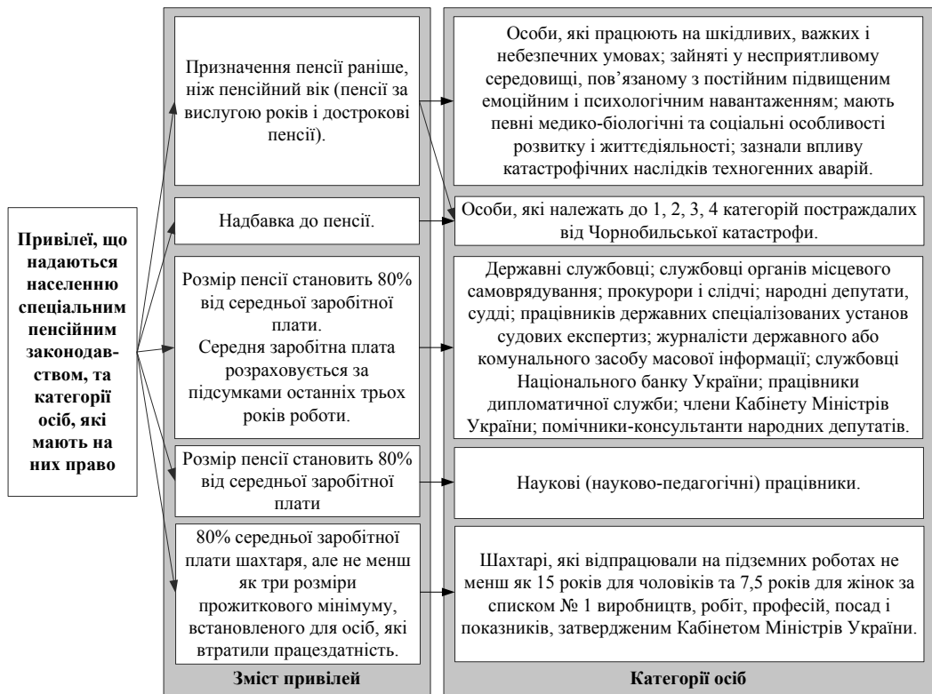
Рис. 1. Зміст основних привілеїв, що надаються населенню у межах спеціального пенсійного законодавства, та категорії осіб, що мають на них право*

Рис. 2 засвідчує, що призначення пенсій для великої кількості населення відбувається на основі окремих законодавчих актів. На початку 2010 р. більше ніж 222 тис. осіб одержували пенсійні виплати з урахуванням вимог норм Закону України “Про пенсійне забезпечення” від 5.11.1991 р. № 1788-XII. Водночас для 75,9 тис. осіб пенсії призначені відповідно до Закону України “Про статус і соціальний захист громадян, які постраждали внаслідок Чорнобильської катастрофи”