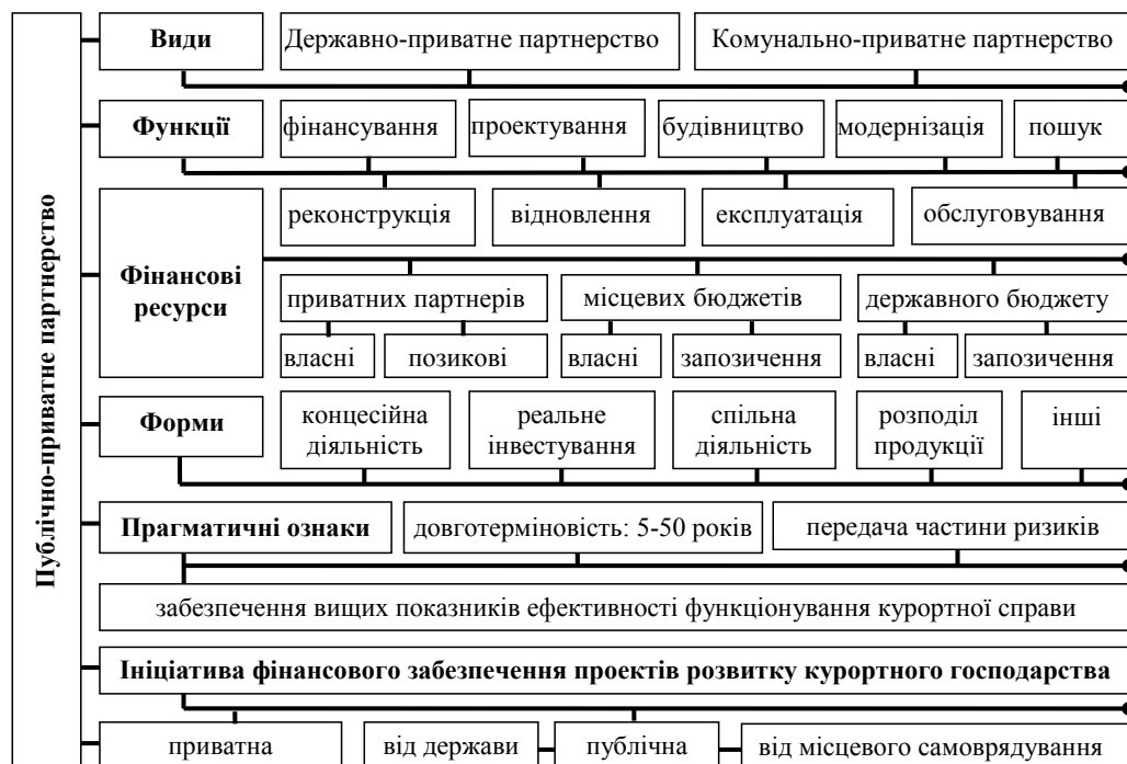
Рис. 1. Структура механізму публічно-приватного партнерства для фінансового забезпечення розвитку курортної справи

постприватизаційні зобов'язання, такі як забезпечення модернізації матеріально-технічної бази курорту, удосконалення асортименту і ціноутворення в напрямку соціалізації курортних послуг, підвищення рівня якості та загальнодоступності курортних благ для людини – виконуються частково або не виконуються взагалі. Приватизація – це не вирішення усіх фінансових проблем санаторно-курортного закладу і не єдиний спосіб подолання низької ефективності функціонування і збитковості, а швидше їх передача до контрагента.