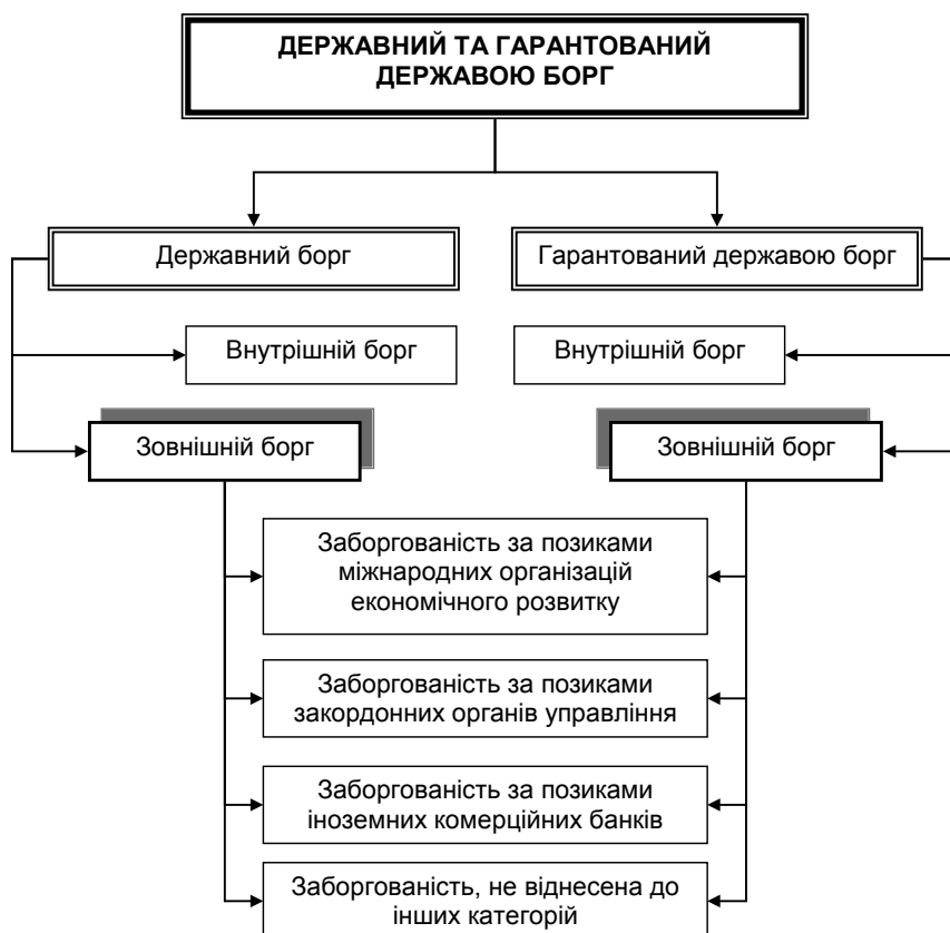
Рис. 1. Класифікація державного боргу та зовнішніх запозичень

Борг держави поділяється на державний борг і гарантований державою борг .