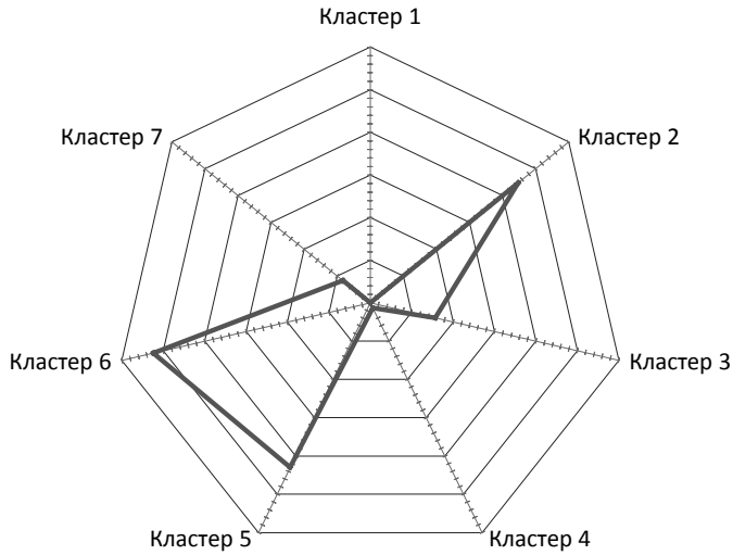
Рис. 3. Графічна інтерпретація ринку перестраховування за результатами кластерного аналізу інтенсивності перестрахової діяльності

запропонувати графічну її інтерпретацію, що, своєю чергою, допомагає однозначно виявляти ринкову позицію будь-якої страхової компанії за обраними ознаками та її потенційних конкурентів.