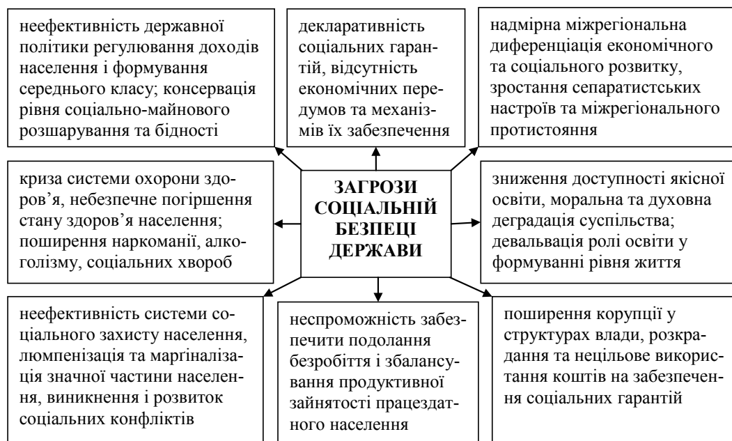
Рис. 2. Загрози соціальній безпеці держави, спричинені недоліками функціонування системи соціальних гарантій*

Зазвичай, порогові значення індикаторів соціальної безпеки визначають на підставі спеціальних багаторічних досліджень [2] та оцінювання досягнутих результатів минулих періодів [27]. При цьому важливо оптимізувати склад показників для уникнення ускладнень при плануванні та управлінні. Агрегація критеріальних показників соціальної безпеки може проводитися шляхом визначення укрупнених індексів із використанням економіко-математичних розрахунків (аж до виведення інтегрального індексу соціальної безпеки), методами