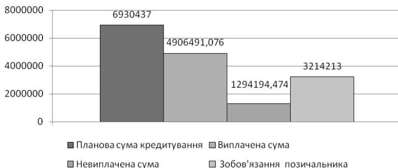
Рис. 2. Кредитування України Світовим банком станом на 31.05.2012 р., тис. дол. США*

Таким чином, кредити розподіляють достатньо рівномірно за чотирма основними напрямками. Причому, 30%, максимальна частка, спрямовуються на фінансуван-