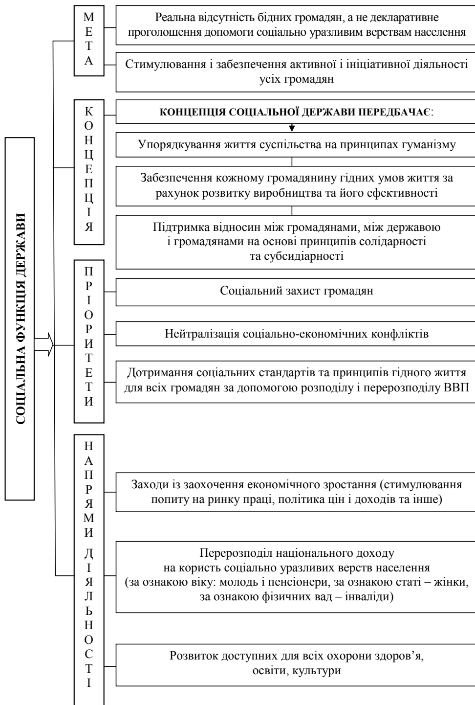
Рис. 1. Змістове наповнення соціальної функції держави