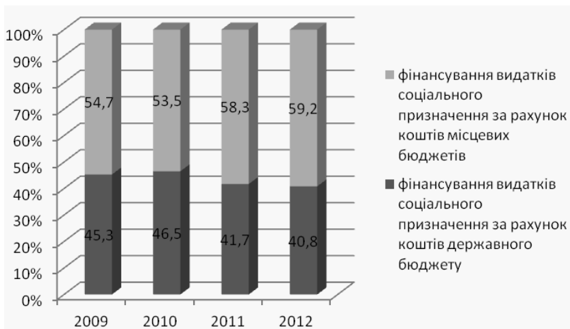
Рис. 3. Співвідношення частки фінансування видатків соціального призначення за рахунок коштів державного і місцевих бюджетів у період 2009–2012 рр.

можливостей держави. Зокрема, у рішенні Конституційного Суду наголошено про те, що механізм реалізації конституційних прав кожного громадянина на достатній життєвий рівень для себе і своєї сім'ї може бути змінений державою, зокрема через неможливість їх фінансового забезпечення шляхом пропорційного перерозподілу коштів з метою збереження інтересів усього суспільства [14, 15].