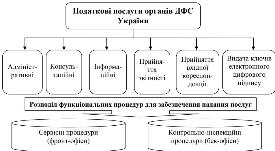
Рис. 2. Перелік послуг, які надають платникам органи ДФС України, та процедури їх забезпечення*

Крім цього, електронні сервіси тісно взаємопов'язані з системою надання ад-