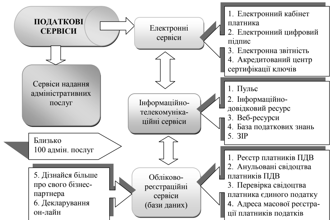
Рис. 1. Класифікація видів податкового сервісу

Як бачимо з рис. 1, поділ податкових сервісів за категоріями на електронні, інформаційно-телекомунікаційні, обліково-реєстраційні та сервіси надання адміністративних послуг, з одного боку, дозволяє чітко їх класифікувати за напрямками використання та безпосереднім призначенням, а з іншого – є досить умовний, оскільки між усіма видами податкових сервісів існує тісний взаємозв'язок, або переплетення функцій шляхом їх взаємодоповнення. Наприклад, інформаційно-телекому-