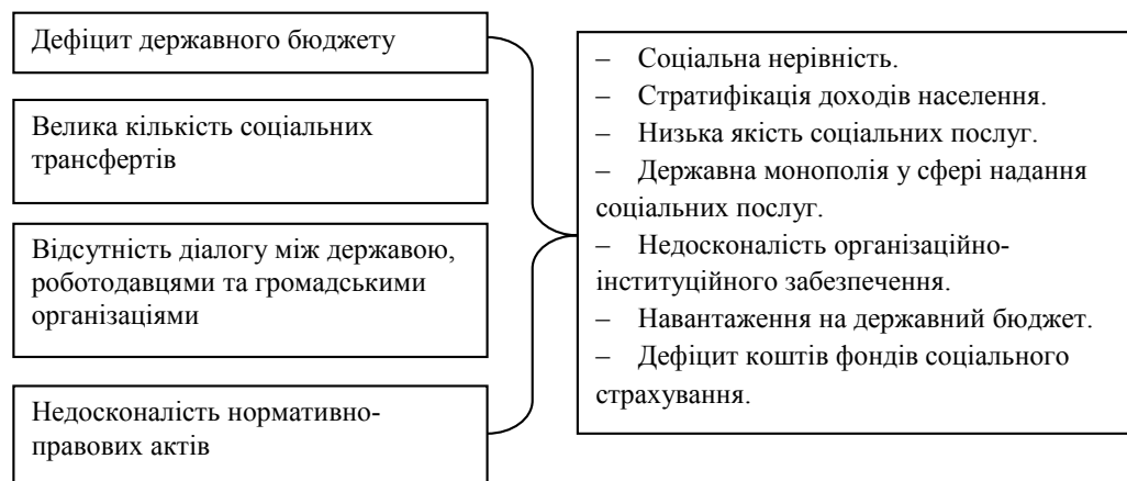
Рис. 1. Недоліки і наслідки неефективного функціонування вітчизняної моделі соціальної політики

ти-сироти, малозабезпечені сім'ї, інваліди, пенсіонери) залишаються без задоволення основних потреб.