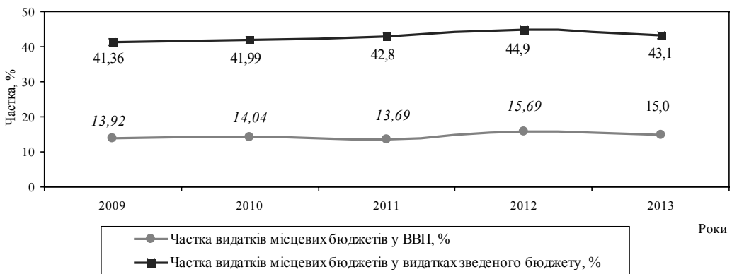
Рис. 1. Динаміка частки видатків місцевих бюджетів України (без урахування міжбюджетних трансфертів) у ВВП та видатках зведеного бюджету у 2009–2013 рр., %.*

– найбільшу питому вагу у видатках місцевих бюджетів України упродовж 2011–2013 рр. займали видатки соціального спрямування – 81,98% (середній показник за три роки), зокрема, на освіту – 32,85%, соціальний захист і соціальне забезпечення – 23,77%, охорону здоров'я – 21,57%, культуру, мистецтво, фізичну культуру, спорт, засоби масової інформації – 3,79%.