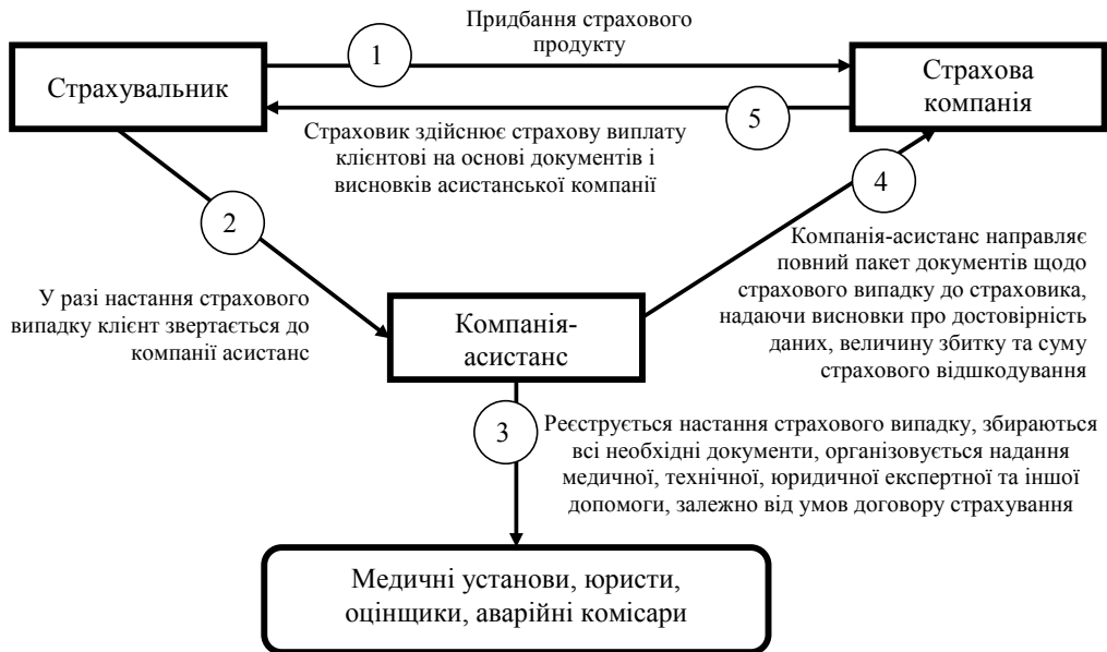
Рис. 3. Алгоритм врегулювання страхового випадку за допомогою асистанської компанії