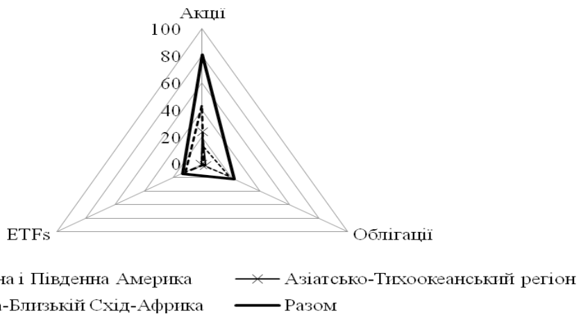
Рис. 1. Обсяги біржової торгівлі основними цінними паперами з географічним поділом у 2014 році (трлн. дол. США)*

1) Акції є основним інструментом біржової торгівлі, виступають локомотивом біржової діяльності та розвитку. Згідно зі звітами WFE у 2014 р. вартість біржових угод, предметом яких були акції, досягла 80,9 трлн. дол. США, що у 3,7 раза більше вартості угод за облігаціями та у 5,9 раза більше ніж вартість угод з ETFs (рис. 1).