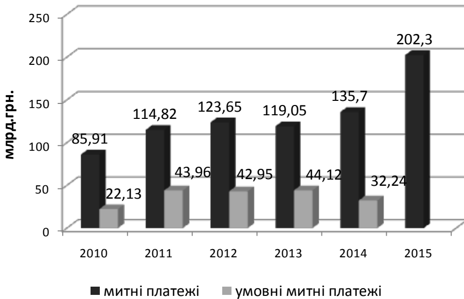
Рис. 3. Діяльність митних органів щодо перерахованих до бюджету та умовно нарахованих платежів у 2010–2014 рр.*