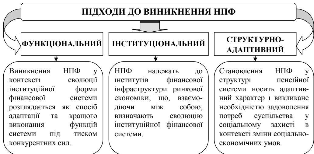
Рис. 2. Підходи до виникнення НПФ*

Висновки. У процесі розгляду переваг та недоліків розподільчої і накопичувальної пенсійних систем з’ясовано, що повністю розподілити ризики пенсійної системи та забезпечити її відповідність ключовим критеріям ефективності можливо лише шляхом комбінації розподільчих і накопичувальних елементів. При цьому з підвищенням ролі