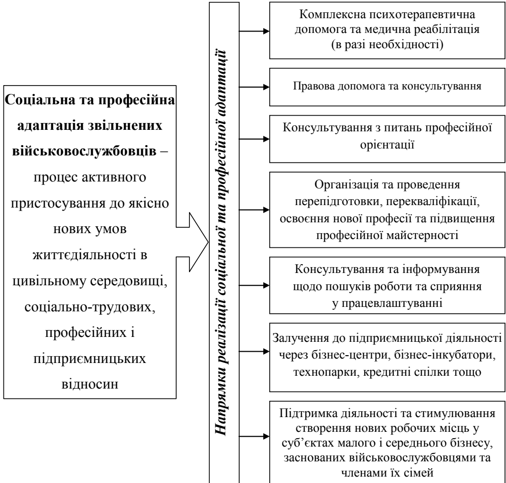
Рис. 1. Структура соціальної та професійної адаптації звільнених військовослужбовців за напрямками реалізації*