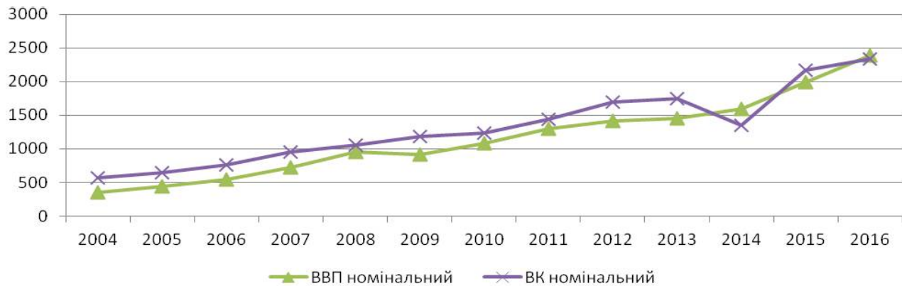
Рис. 2. Динаміка власного капіталу (ВК) реального сектору економіки та ВВП в Україні в 2004–2016 рр., млрд грн