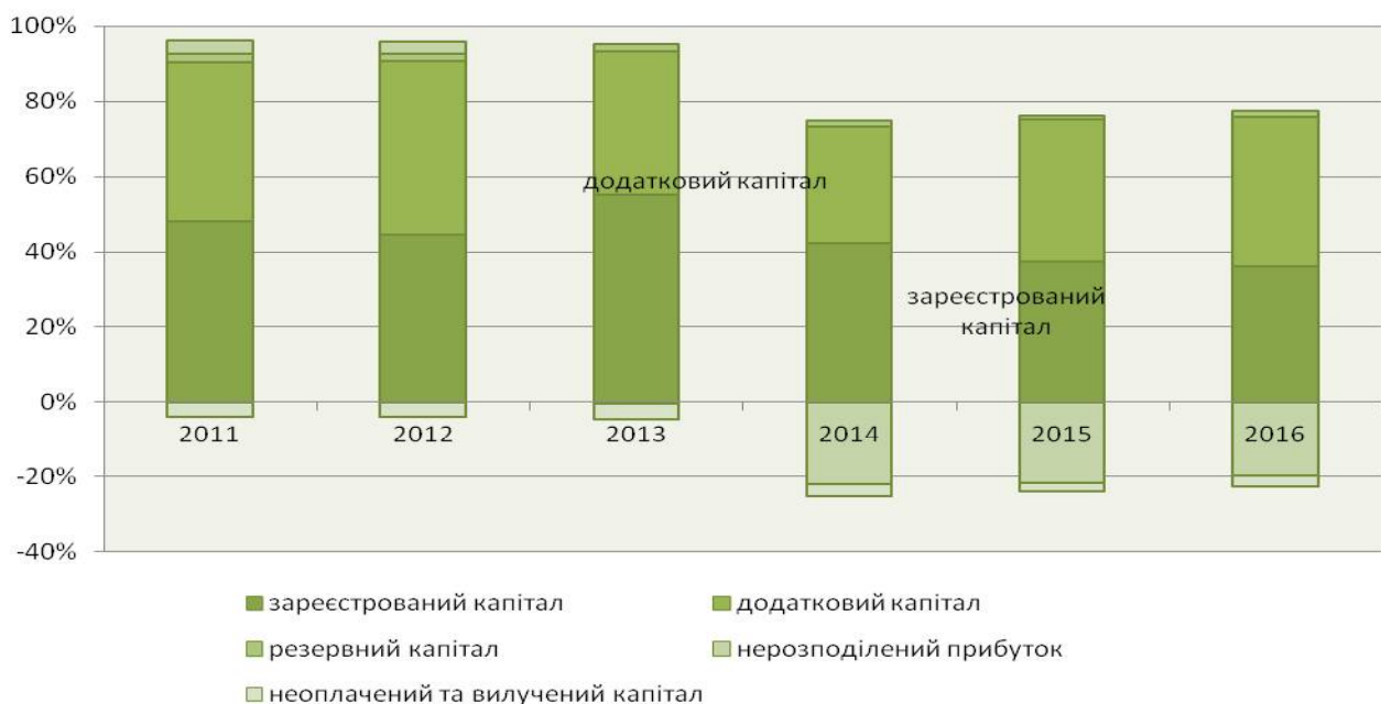
Рис. 4. Структура власного капіталу підприємств реального сектору економіки України у 2011–2016 рр., %*

Упродовж 2011–2016 рр. мала місце загальна декапіталізація реального сектору економіки на 18% (у цінах 2011 р., за показником балансової вартості власного капіталу), виникли структурні диспропорції у міжсекторальному розподілі капіталу. Дефіцит власного капіталу справляв подвійний негативний вплив на фінансову систему країни – як недостатність джерел фінансування продуктивного капіталу і як чинник системних ризиків. Номінальне зростання агрегованого власного капіталу підприємств реального сектору економіки упродовж