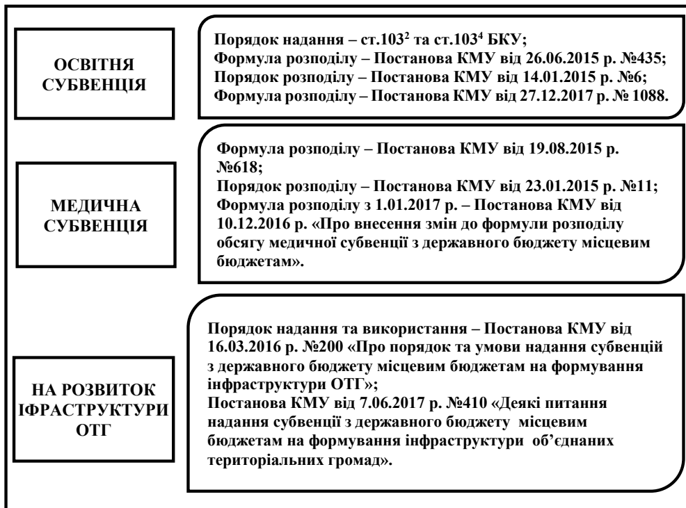
Рис. 4. Нормативно-правове забезпечення деяких видів субвенцій об'єднаних територіальних громад*