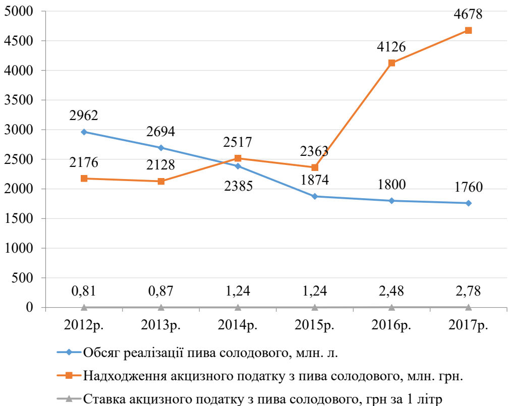
Рис. 3. Динаміка обсягів реалізації пива солодового та акцизного податку з пива солодового*

З одного боку, прямим наслідком підвищення ставки акцизного податку з пива має бути збільшення доходів державного бюджету. Порівнюючи темпи зростання ставок акцизного податку з пива протягом