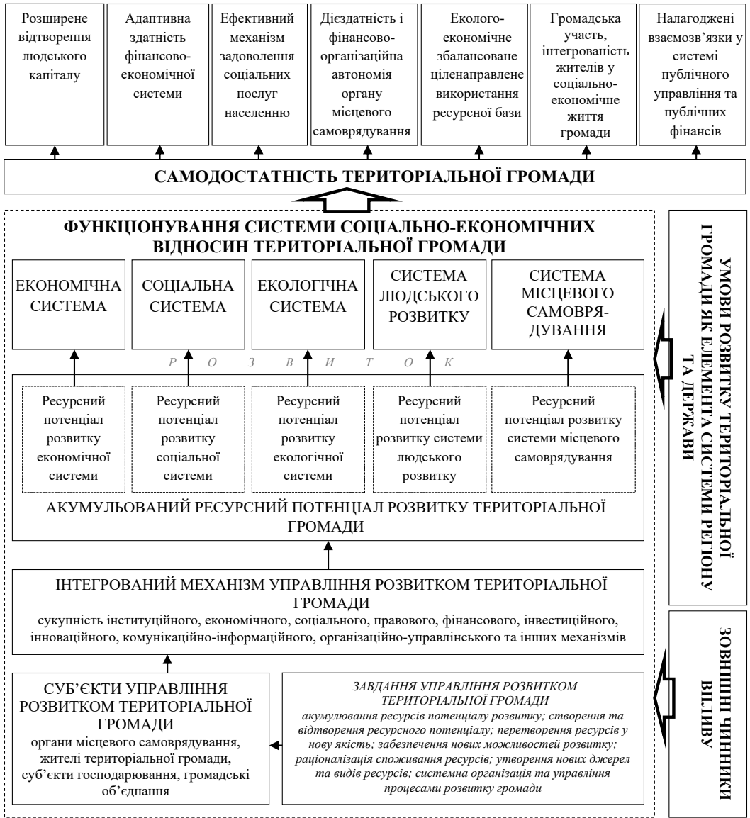
Рис. 1. Організаційно-економічні засади розвитку територіальної громади як системи у контексті досягнення власної самодостатності*