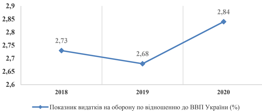
Рис. 1. Динаміка частки видатків на оборону у ВВП України за 2018–2020 рр.*