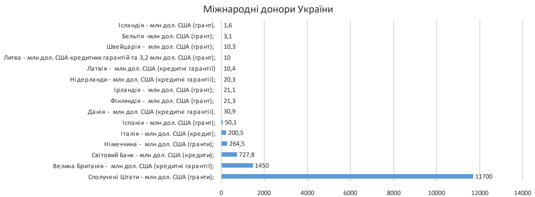
Рис. 1. Кошти, надані Україні через Цільовий фонд Світового банку в 2022 р. [27]

Вони були розподілені за такими пріоритетними сферами: сільське господарство