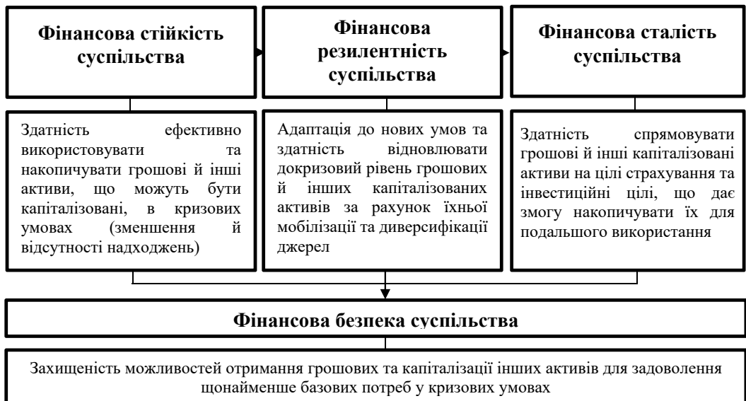
Рис. 2. Складові фінансової безпеки суспільства*

Розподіл публічних фінансів для зниження соціальної вразливості вимагає фінансування соціально-захисних і проактивних заходів. Проактивні заходи означають включення незахищених категорій населення в діяльнісні процеси (навчання,