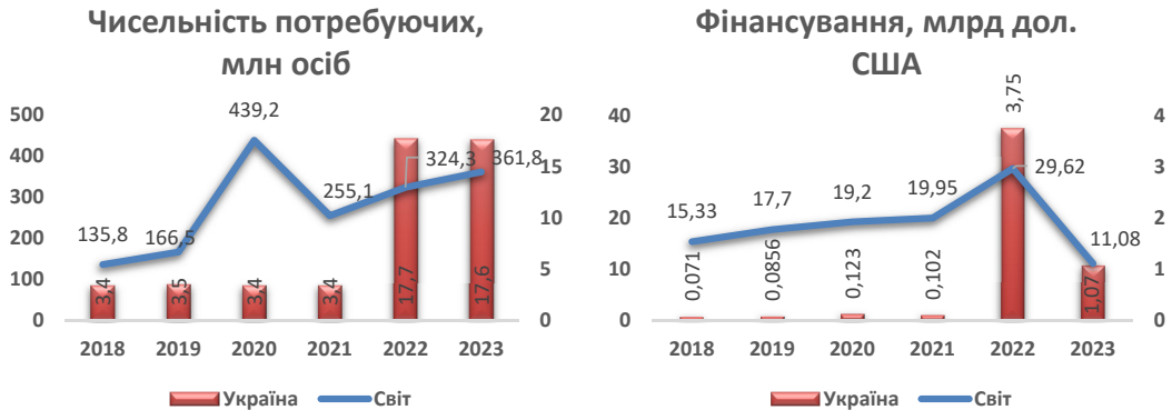
Рис. 3. Чисельність осіб, які потребують гуманітарної допомоги в Україні та світі, й обсяги фінансування відповідних заходів, 2018–2023 рр.*